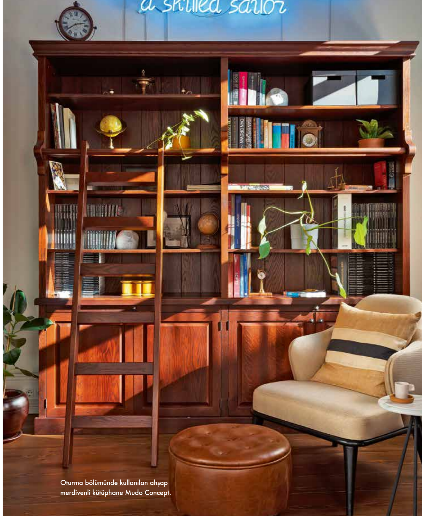
Oturma bölümünde kullanılan ahşap merdivenli kütüphane Mudo Concept.

A smooth sea never made a skilled sailor