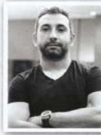
MIMAR SERTER KARATABAN TEAM FORES MIMARLIK

"Televizyon yıllardır kullanmadığım bir cihaz. Sadece çalışma odamda Apple TV ile kullanıyorum ve orada da duvara asılı duruyor. Ben aslında televizyon ile ilgili tüm üniteleri hayatımdan çıkardım. Televizyon ünitesinin yerine mümkünse boş bir duvar ya da ihtiyaca göre kitaplık yapılabilir. Bir duvar ya da boşluk boyunca olan üniteleri tercih ediyorum. Yerini referans olmaksızın serbestçe bulan açık ünitelerden hoşlanmıyorum."